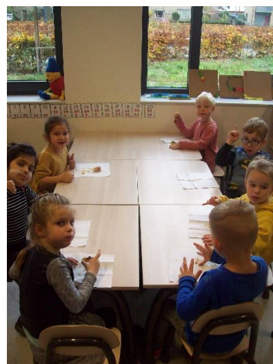
Hmmmm, lekker smikkelen en smullen van onze zelfgemaakte appelnotentaart!