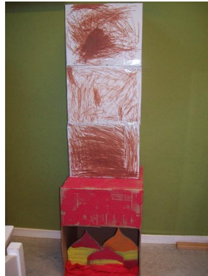
Onze open haard.