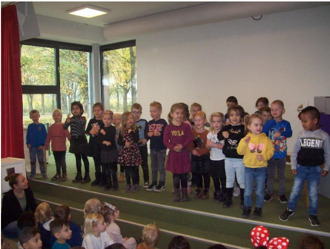
Ons optreden op het podium van het lied "pak je laarzen".

Vorige week vrijdag hebben we thema herfst afgesloten met een geweldig feest voor Boris Boef. Alle klassen hadden op donderdag een heerlijke appel-notentaart gebakken die de kinderen vrijdag, na het optreden op het grote podium voor elkaar, in de klas hebben geproefd. Het was erg gezellig en lekker.