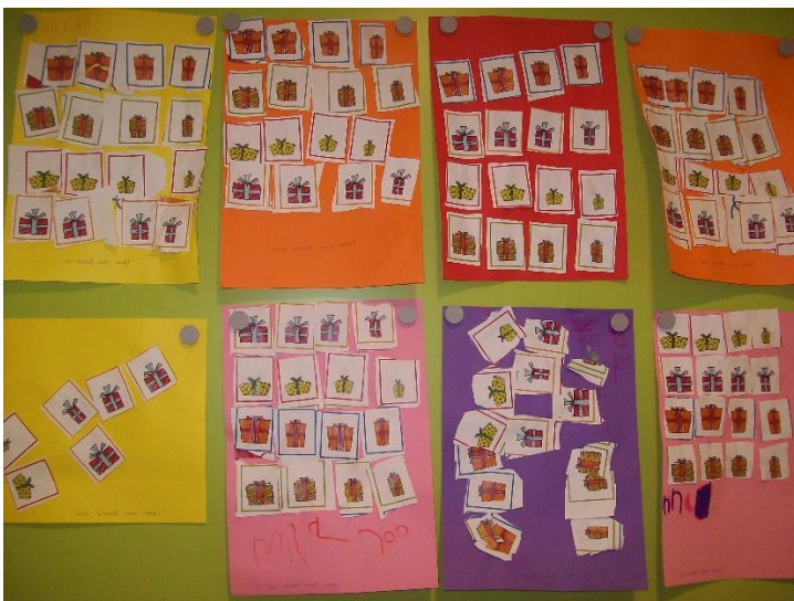
Van breed naar smal.