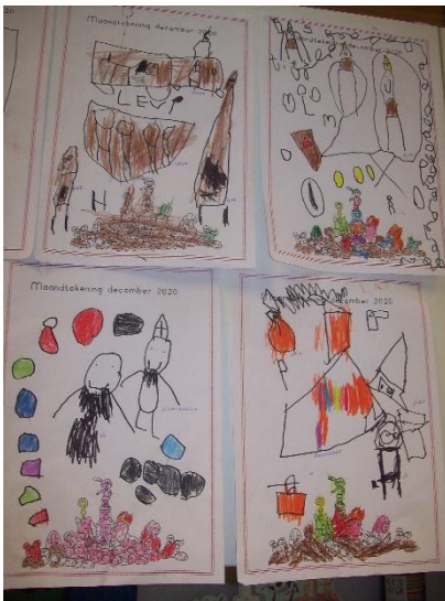
Maandtekening thema Sinterklaas.

Maandag zijn we gestart met ons nieuwe thema: Sinterklaas. We kijken elke dag het sinterklaasjournaal op school. Dit is ook de rode draad in het thema. In de huishoek hebben we een open haard geknutseld, waar de kinderen hun schoentje kunnen zetten. Ook hebben we al verschillende werkjes gemaakt rondom dit thema.