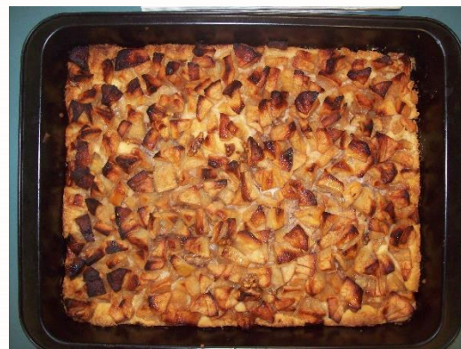
Dat ziet er lekker uit; appelnotentaart!