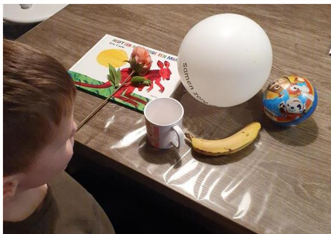
de lettertafel van Quint