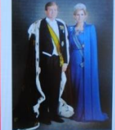
de koning de koningin